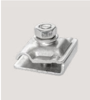
MSP-PR-GCC, Art.-Nr. 22963