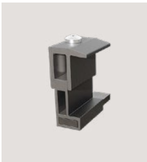
MSP-FR-HCB, Art.-Nr. 22719