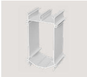
MSP-FR-G-AS, Art.-Nr. 22891