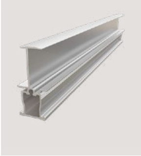
MSP-PR-IC 30, Art.-Nr. 22892

Verbesserte Dachästhetik dank geschlossener Modulfläche.