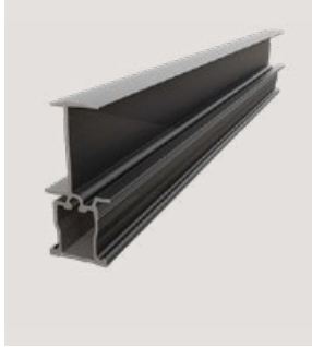
MSP-PR-ICB 30, Art.-Nr. 22900, 22903 MSP-PR-ICB 35, Art.-Nr. 21024