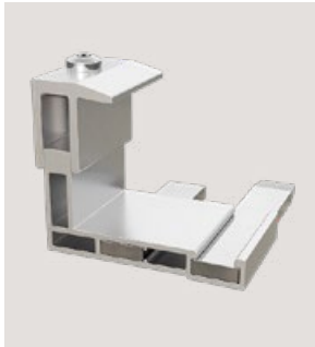
MSP-FR-LC, Art.-Nr. 22700