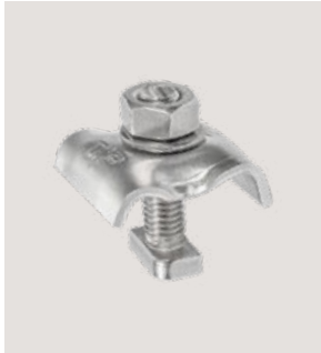
MSP-PR-GCA, Art.-Nr. 21965