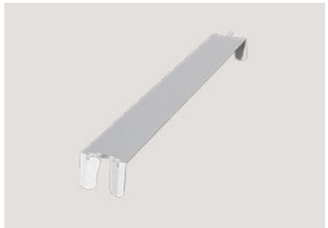
Ballastträgerklammer , MSP-FR-EW-BC, Art.-Nr. 22970