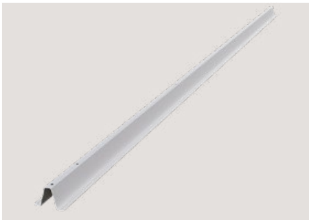
Ballastträger , MSP-FR-BT, Art.-Nr. 22964, 22965, 22966, 22967, 22968, 22969

Sämtliche Modulgrößen werden über wenige Teile abgedeckt.