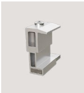
MSP-FR-HC, Art.-Nr. 22629