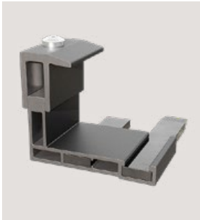
MSP-FR-LCB, Art.-Nr. 22717

Für die Befestigung grosser PV-Module an der mittleren Abstützung, um höhere Wind- und Soglasten aufzunehmen.