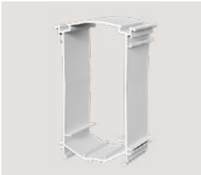
MSP-FR-EW-SH, Art.-Nr. 2072554

Effiziente Lösung für einfaches Nachrüsten auf bestehenden Gründächern, basierend auf dem bewährten PV-Montagesystem MSP.