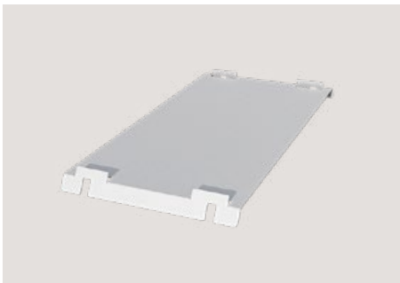
Ballastträger-Startblech , MSP-FR-EW-BS, Art.-Nr. 22972