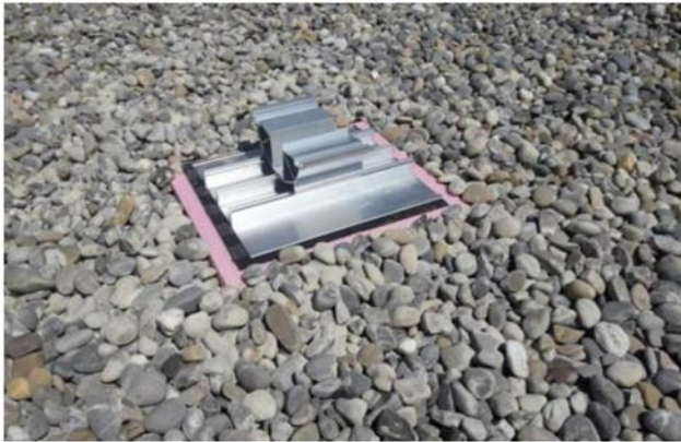
Image 5: Poser la plaque de base avec support (avec du non-tissé sous cette plaque)