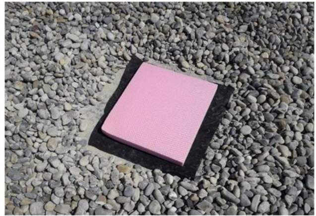
Bild 4: Einbringen der Zwischenlage aus XPS, unterlegt mit Schutzlage aus Vlies (sofern nötig)